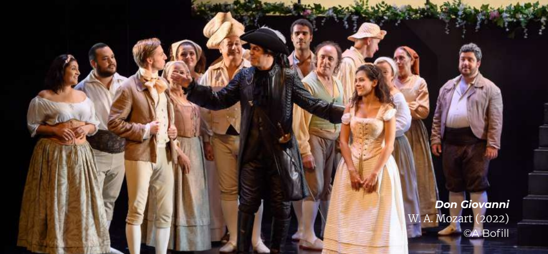
Don Giovanni W. A. Mozart (2022) ©A Bofill