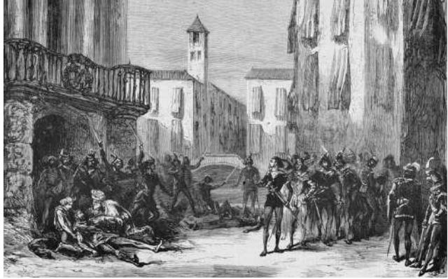
Il·lustració del tercer acte de Romeu i Julieta durant l'estrena a París, l'any 1867.

ritme de vals, amb una inestabilitat tonal que transmet el seu nerviosisme. El final del madrigal, amb la parella cantant a duo després d'un joc de seducció, augura la seva unió. L'anacrònica presència del vals –inexistent a l'època de Shakespeare– és una concessió a la Juliette de l'estrena, Caroline Miolan-Carvalho, apassionada pel ball. Gounod va utilitzar la venturosa tonalitat de re major per descriure l'única nit d'amor dels adolescents, ja casats, i presentant-la com a metàfora de la mort; al somni de Julieta, l'estatisme musical mostra l'atmosfera d'irrealitat i engany. La gran scena de Roméo al panteó transporta als pentagrames la seva agitació creient morta a Juliette. El final, en la tonalitat de mi bemoll major –mig to més aguda que re menor i exempta de dramatisme–, porta un missatge clar: el triomf de l'amor més enllà de la mort i dels odis ancestrals.